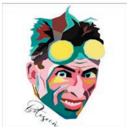
Associazione Culturale Ottavio Bottecchia